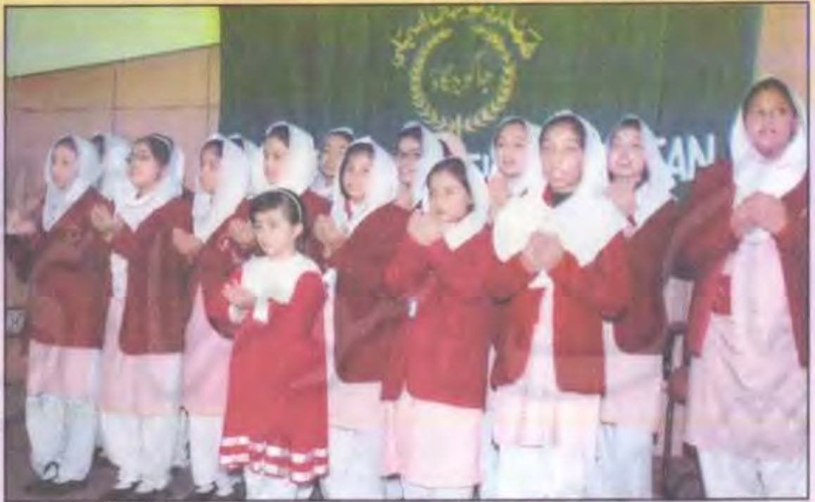
ہمدرد نونہال اسمبلی لاہور میں نونہال طالبات دعاے سعید پیش کر رہی ہیں۔